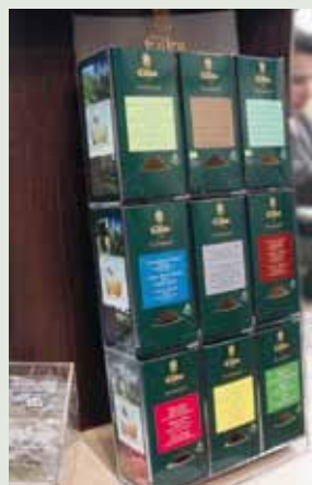
Acryl display für 9 Faltschachteln Luxury World Selection Art-Nr. 6648

8. KRÄUTERGARTEN Kräutertee 2,5g Naturbelassene Kräutermischung aus südafrikanischem Rooibos, Zitronengras, Minze, Fenchel, Süßholzwurzel, Zimt, Heidelbeeren und Kamille. Ein erfrischender und wohltuender Genuss zugleich. Ziehzeitempfehlung: 5-8min Art-Nr. 4457 – 5 x 20 Stück im Umkarton