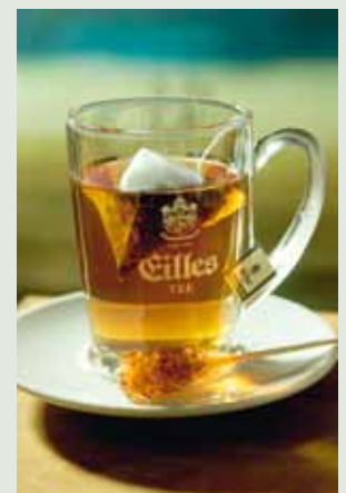
EILLES TEE Trendglas für 0,3L - Art-Nr. 6679 Untertasse - Art-Nr. 6418 Ablegeschale - Art-Nr. 6699